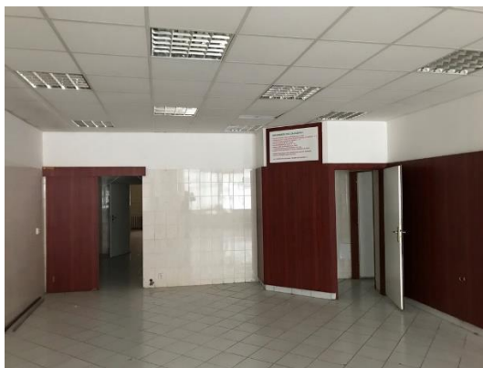
Pohled na stávající stav v čelní části prostor

Podlahy v přední části jsou z keramických dlažeb – jsou v dobrém stavu a nebudou stavební úpravou dotčeny.