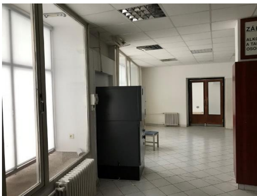
Pohled na umístěný bankomat

V prostorách se nachází bankomat Komerční banky a.s. Pro zajištění uskladněných dokumentů a oddělení přístupu ke stávajícímu bankomatu bude bankomat oddělen od prostor spisovny lehkou příčkou. Dělicí stěna bude provedena z nosného rámu, tvořeném z ocelových žárově pozinkovaných (15 \mu m) uzavřených profilů Jackl 50x50x2 mm, vzájemně svařených.